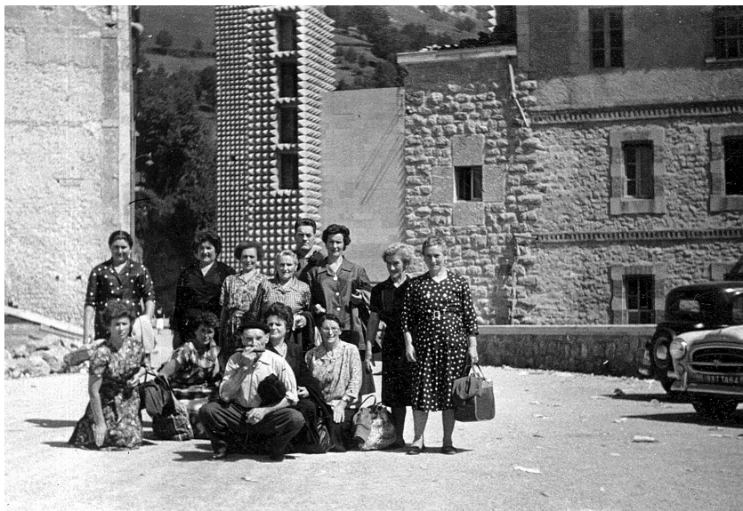
Oromiñoko nagusi batzuk Arantzazun, 1961.

Handik ordu erdi baino lehenago, hauxe esan neban, beste gauza batzuen artean, homilian: Jaungoikoak ez deuskula emon burua sama gainean eroateko, beragaz pentsetako baino. Ez neban gura izan nortzuk ziran jakiterik. Gero horretan ibili ziran guardia zibilak be ez dot uste jakin ahal izan ebenik.