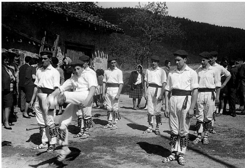
Oromiñoko dantzariak, 1960.