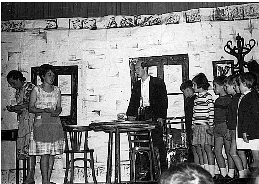
Antzerkia Etxebarrin, Nire senargaia , 1969-70.

Markinan bertan be erderea zan nagusi, nahiz eta ia danak jakin, eta askok hobeto beharbada, euskerea. Baina baegozan, mutilen artean be, euskerea beharbada ulertzen ebenak, baina egiteko gauza ez ziranak, Markinako kaletarren artean.