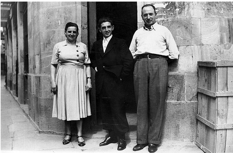
Curasoakaz denda aurrean, Durango 1950.

Ibarruritik barrero Durangora joan eta uste dot laster izango zala eskolan hastea, Komentu kalean monja agustindarrek euken Santa Susana ikastetxean. Hobeto esateko, badakit ikastetxeak Santa Rita izena dauela, nahiz eta gehienok beti Santa Susana esan, hori dalako komentuaren izena.