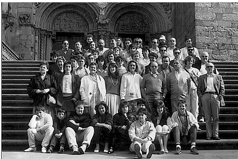
Berrio Otxoa abesbatzagaz Galizian, Santiagon, 1986.

Danok mundu guztiko eta, batez be, geure herriko musikaz gozatzeko eta gozatu eragiteko eta Euskal Herriko eta kanpoko beste abesbatza askoren lagunekin adiskidetasun lokarriak sortzeko ahaleaginean, anai-arreba giro pozgarrian. Egin nebazan ahaleginak baino askoz be gehiago izan ziran emon eustazan pozak eta une atseginak.