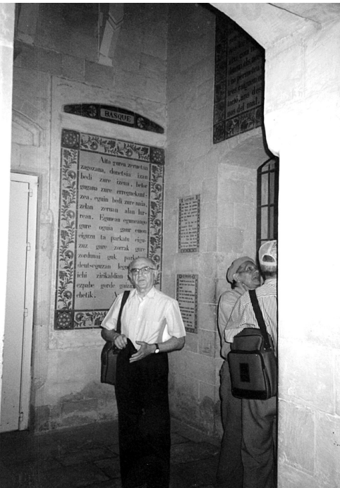
Jerusalem, Olibeti mendian, Aita gurea, 1999.

Harrituta itxi ginduzan, legez Israel izan barik, israeldarren menpean egozan lurraldeetako leku historikoetan, oraindino ia mutiko ziran israeldar ikasle nagusienak ametrailadorak eskuan eta ebilzala ikusteak. Palestinarrak bizi ziran toki horreek ikusten ziharduen israeldar neskato-mutikoak zaintzeko egiten eben hori.