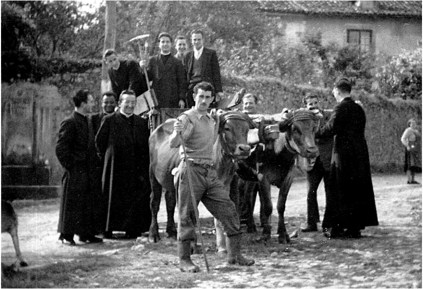
Ruiloban, domeka arratsaldeko dotrinan, 1956-57.

Hurrengo urtean, gaztetzuekin, hamabost-hamasei urtekoekin egokitu jatan. Denpora gehiago egiten genduan landan baloia zelan jo behar dan ikasten, barruan liburuagaz baino. Izan be, mitikoak ginan inguruko gaztetzuentzat Unibersidadeko futbol-taldeko selekzinoan jokatzen genduanok. Baina, horregaitik, dotrinan esaten genduanak be askoz be indar gehiago eukan eurentzat besteenak baino. Eta asko ikasten ez baeben be, gitxienez lagun handi izaten ginan gerorako be.