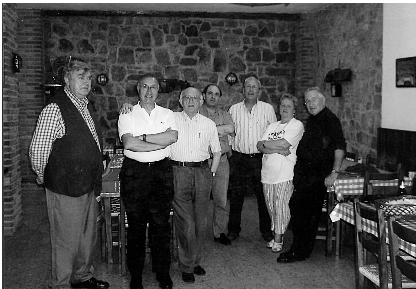
Euskal Baliabideak taldea, Ondarroan, 2009.