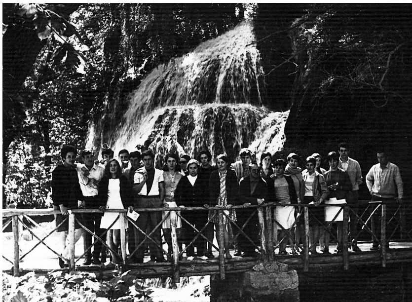
Etxebarriko gazteakaz Monasterio de Piedran, 1968.

Hurrengo goizean, ugazabei parka eskatzera ninoiala, honeek: “Ha sido el grupo de jóvenes más educado”. Nik orduan “Entonces, los que protestaban...”. “Ah, dos viejos cascarrabias”. Hantxe amaitu zan nire benetako haserre. “Eguzkia agertu da!” esan neutsen kope-tilun eta ni hain ilun eta haserre ikusita harrিতa egozan gazteei.