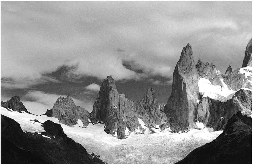
Chalten mendia (Argentina).

Ibilaldi ederra, inguruan mendiak, arbolak... Eta lau orduz ibili eta gero, ederra baino ederragoa izan da begien aurrean izan doguna. Merezidu izan dau. Hornea lako mendiak, altzoan edurra daukiela, eta glaziar txikitxua, lakuan musturra sartuta. Lakua berde kolorekoa da, eta bazterrean, urtu bako izotz zatiak, eguzkiak eta urak sortutako irudiez apaindurik. Baketan egon gara, hari guztiari begiratzen. Dana isilik. Uretan sartu, eta oinek eskertu deuskue, hotz-hotz egon arren. Eguzkiak handik goitik laztandu gaitu, behar genduan berotasuna emonda. Ha dana begietan sartu eta gero, bueltarako bidea errazago egin jaku.