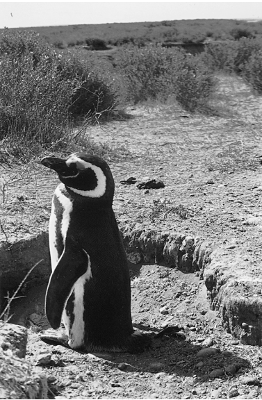
Pinguinoa Valdes peninsulan (Argentina).

Txalupaz itsasoan sartu gara izurdeak ikusteko. Bidean fokak be ikusi doguz. Zorionekoak izan gara, fokek ia denpora guztia, % 90 baino gehiago, urpean emoten dabe-ta. Hemengo izurdeak be ikusi doguz: beheko aldea zuria daukie, eta goikoa iluna. Politak. Itsasoa bare-bare egon da, eta ezin urdinago, zerua lez, hodei bat bera be ez da egon. Nahiz eta txalupea jentez beterik egon, disfrutau egin dogu, animaliak horren paraje ikusten.