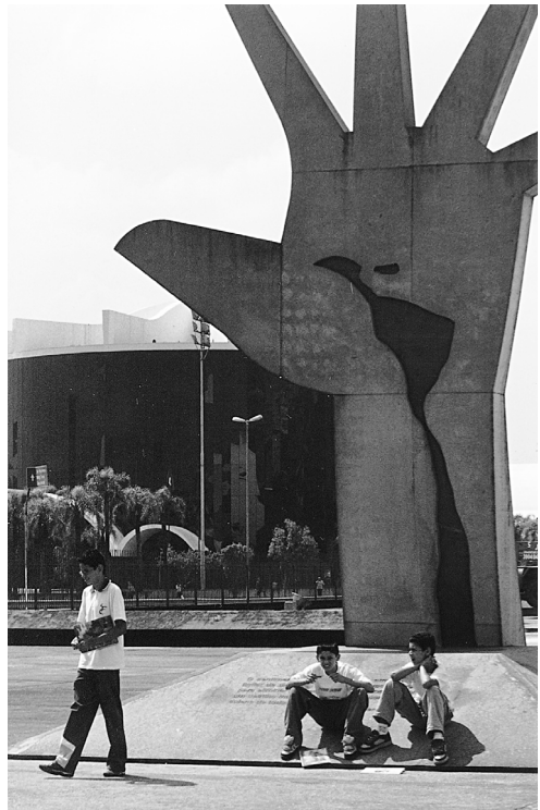
Memorial da America Latina edo Amerika Latinoaren Me- moriala, Sao Paulo (Brasil).

Sao Paulo ezaguna da daukazan museoakaitik. Eta hori izan da hona etorteko arrazoi nagusia. Museoek bilduma onak dau- kiez, aro eta estilo guztietakoak. Museo de Sao Paulo ikusi dot lehenengo, museoen erreketan murgiltzen hasteko. Batez be, Bra- sileko pintore eta eskultoreen lana ikusi dot. Ederra. Arte galerie- tan be izan naz, eta Museo de Sao Paulon ikusi nebana barrero ikusi dot brasildarren pinturretan: argitasuna.