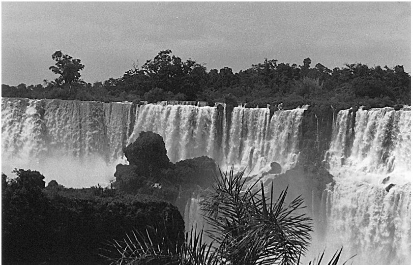
Iguazuko ur-jauziak (Argentina eta Brasil).

Foz de Iguazuraino ikusi ez dodazan motxilero guztiak bertan dagoz: azal zuria, ule argia... Gringitoak. Neure lez. Aterpetxea