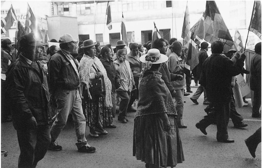
Koka-landareen nekazarien manifestazioa, La Paz (Bolivia).

ka euren sorburutzat hartzen dabela. Sindin Loka lehenengo inkea izan zan eta Mama Coca izeneko andreagaz ezkondu zanean, Cuzco konkistau eta inken inperioa hasi zan.