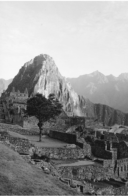
Machu Picchu (Peru).

Sartu nazanetik ezin dot irribarrea arpegitik kendu, neu baino indartsuagoa da. Lekuak zeozer berezia ernaltzen deust barruan, eta arpegitik urtetten deust.