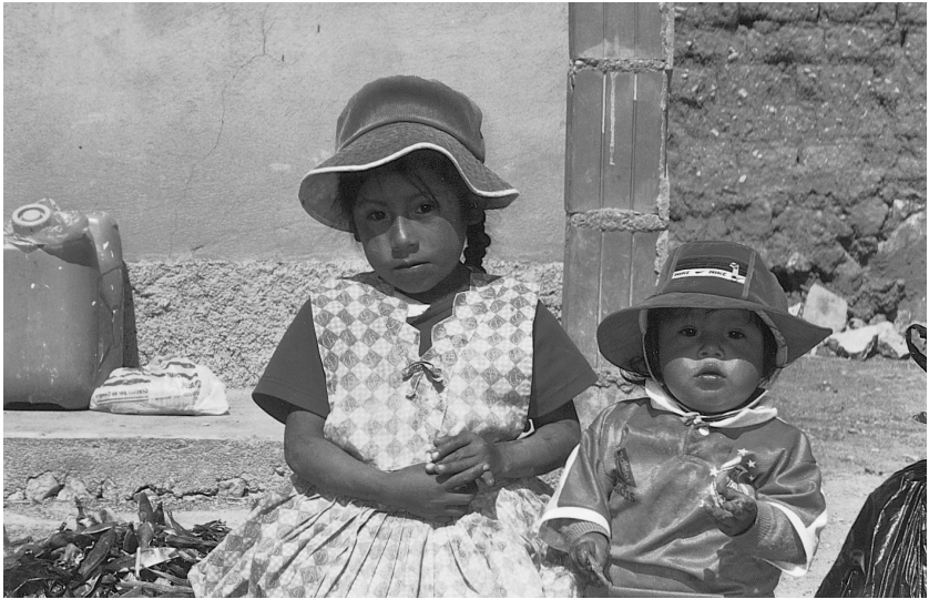
Umeak Eguzkiaren Ugartean, Titikaka (Bolivia).

dogu, Peru, Bolivia, lakuan agiri diran ugartetxuak...; hiru orduko paseoaren ostean bidean gizon bat ikusi dogu. Ugarteko museoa jagoten dauena. Ugartearen alde honetan zabaldurik dagozan aztarna guztiai museo esaten deusie. Tiwanakotarren eta inken sasoiko aztarnak dagoz. Gizonagaz berbaz egon gara eta euren historia kontau deusku. Orduan jaubetu naz zein desbardi-na dan bizitzearen ganean daukien ikuspegia. Sinismenek berezia eta aberatsa egiten dabe euren bizimodua. Lehen gurean izaten zan lez. Izan be, guk geuk daukaguna daukie, gauza materialak, eguneroko bizimodua; eta horrezaz ganera, beste mundu bat, eurakaz batera bizi dana. Gizonak itaundu deusku ea bidean inkearen oinatza ikusi dogun. Ez dogu ikusi, ondotik pasau arren. Azaldu deusku eurak tiwanakotarrak dirala. Inkak eguzkiaren seme-alabak baziran be, ugartera etorri ziranean tiwanakotarrek bota egin ebezan. Gero inkak Cuzco aldera joan ziran eta handik