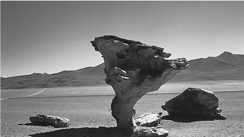
Harrizko arbolea, Uyuni (Bolivia).

Gatz-lautadatik urten dogu eta inguruan dagoan basamortuan sartu gara, lau mila metrotik gora. Basamortua, ostera, ez da kolore edo tonu bakarrekoa. Gorritik beilegira eta marroira artean dagozan kolore guztiak topau zeinkez bertan. Harrigarria egiten jaku naturearen handitasuna, eta zoragarria da lurra, bera bakarrik, zenbat forma eta kolore sortzeko kapaz dan. Harrigarria, benetan, eta gehiago hondino begien aurrean ikustea. Izan