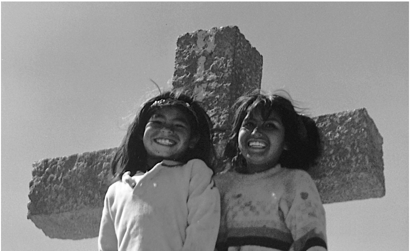
Umeak Kondorraren kurutzean, Colca arroan (Peru).

Goizaldean, bide bazterrean andrak ikusi doguz, soineko trazidionalaz jantzita eta eskulanak saltzeko lekua preparentan.