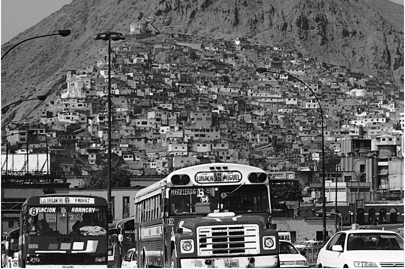
Limako txabolak eta kaleak (Peru).

osoan. Badago zer kontau, ia urtebete alkar ikusi barik egon eta gero. Berezia. Etxetik hain urrin, ezagututakoagandik urrin-urrit. Eta, aldi berean, alkar batzen gaituana are eta nabarmenagoa egiten da leku ezezagunean. Lekua are eta bereziagoa da.