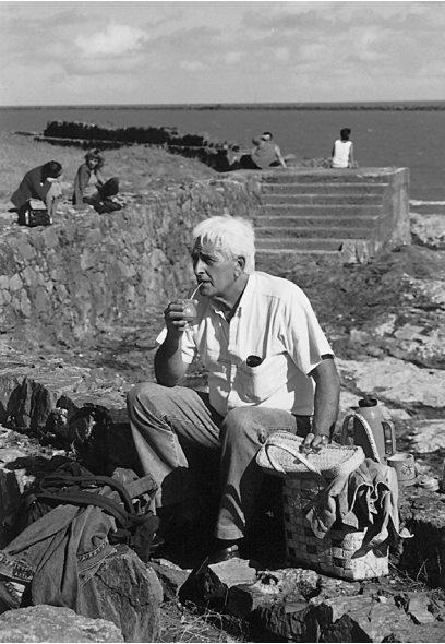
Gizona matea edaten (Uruguai).

Buenos Airesetik Uruguaira joan gara, Colonia de Sacramento, hara joaten da-ta Buenos Airesetik urteten dauen ferrya. Oraingoan dirua ez da izan inportantea, eta bertan hiru egun emon doguz hareatzan, eta herria, Giza Ondare Historikoa dana, barrero ederresten. Sacramenton etxe gozo baten egon gara, La Posada de los Poetas izenekoan. Etxeko bikoteak hilebete bi lehe-